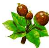
Ingrossamento dei frutti (J)

Le varietà monitorate sono Golden Delicious, Granny Smith, Gala, Fuji, Red Delicious. La fase fenologica rilevata risulta essere più anticipata rispetto alla scorsa stagione. I valori minimi e massimi individuati mediamente nelle 4 aree di monitoraggio sono riportati nella tabella seguente: