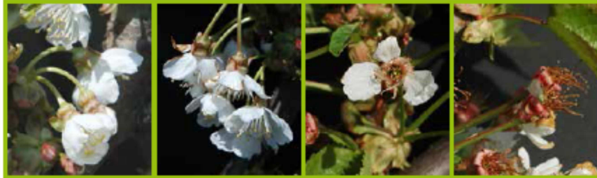
E Stami visibili BBCH60