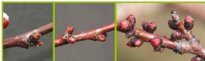
A Gemma d'Inverno BBCH00