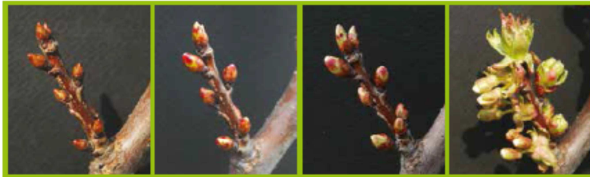
A Gemma d'inverno BBCH00