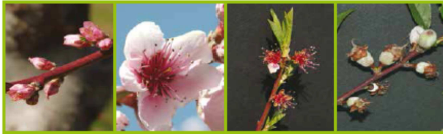
E Inizio fioritura BBCH60