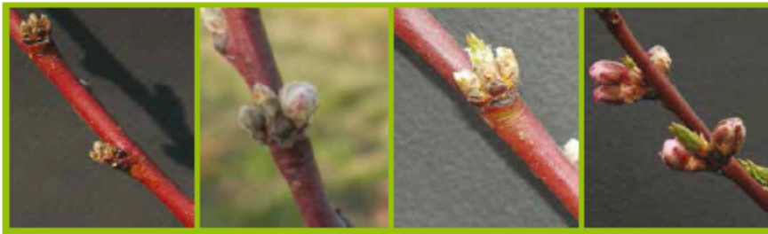
A Gemma d'inverno BBCH00