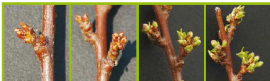
A Gemma d'Inverno BBCH00