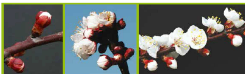
D Corolla visibile BBCH57