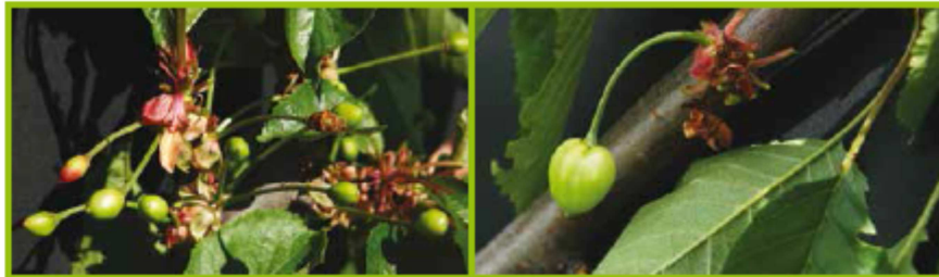
I Scamicciatura BBCH72