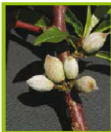
I Accrescimento frutto BBCH75-79