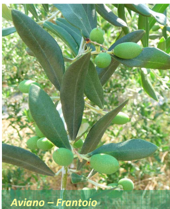
Aviano - Frantoio