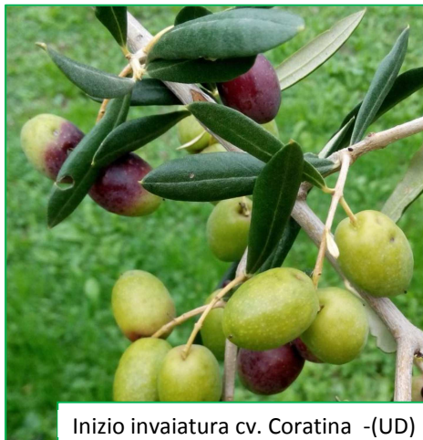
Inizio invaiatura cv. Coratina -(UD)

In quasi tutte le località della Regione le varietà precoci hanno raggiunto la maturità di raccolta ed è iniziata l'invasatura anche della cv. Bianchera (in fase più avanzata soprattutto nelle località climaticamente più favorite della provincia di Trieste).