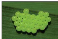
Palomena prasina: gruppi di 28 uova su pagina inferiore