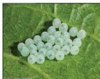
Halyomorpha halys: gruppi di 20-30 uova su pagina inferiore