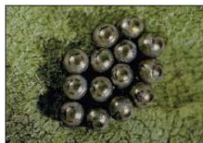
Rhaphigaster nebulosa: gruppi di 14 uova su pagina inferiore