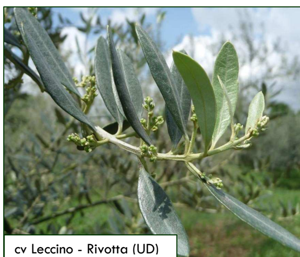
cv Leccino - Rivotta (UD)