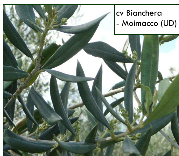
cv Bianchera - Moimacco (UD)