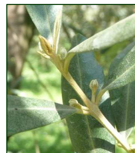
cv Frantoio - Aviano(PN)