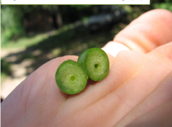
Ingrossamento del frutto – San Dorligo (TS)