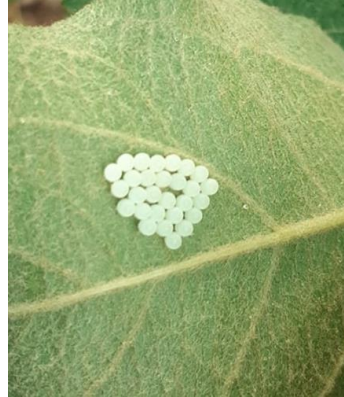
Ovatura di Halyomorpha halys