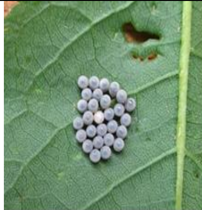
Ovatura parassitizzata di cimice asiatica ( Halyomorpha halys )