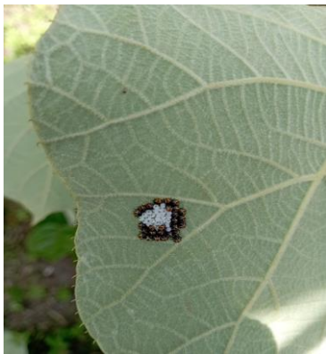
Ovatura con forme giovanili di cimice asiatica ( Halyomorpha halys )