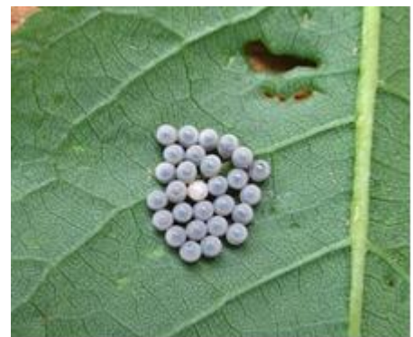
Ovatura parassitizzata di cimice asiatica