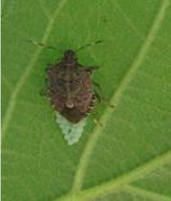
Femmina di Halyomorpha halys in fase di ovideposizione