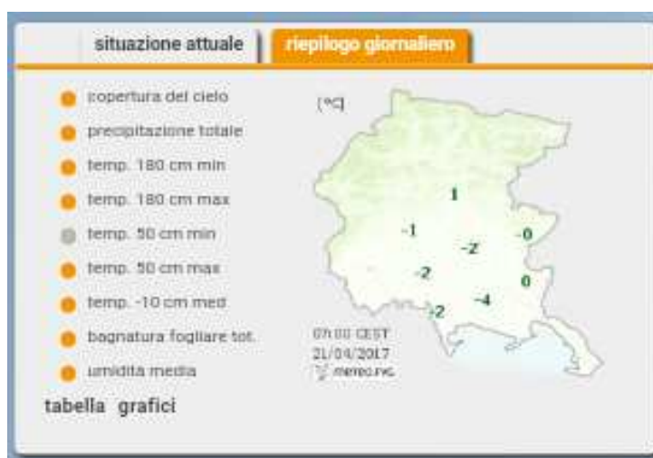
Grafico 1: riepilogo giornaliero dei dati meteo del 21/04/2017 ore 7:00.

I dati di temperatura minima a 50 cm dal terreno sono rappresentati nel grafico 1. In questo momento è necessario attendere per valutare come le piante si riprenderanno e a quel punto verificare concretamente i danni della gelata.