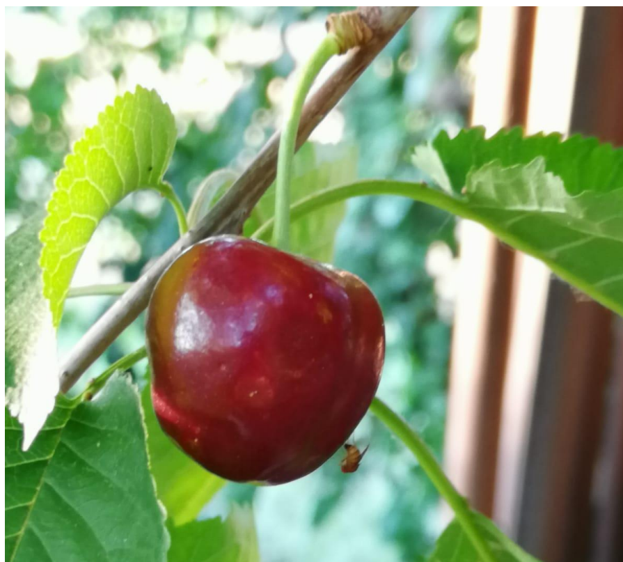
Drosophila suzukii su ciliegia