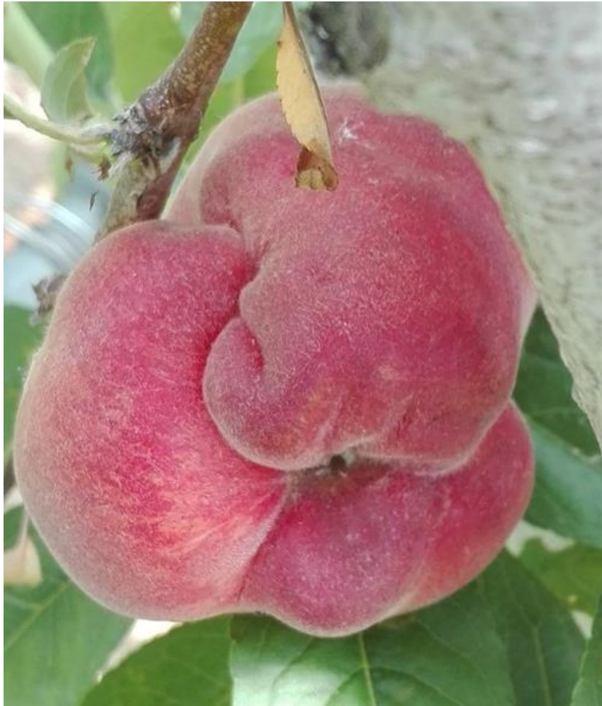
Deformazioni su pesca causate da H. halys