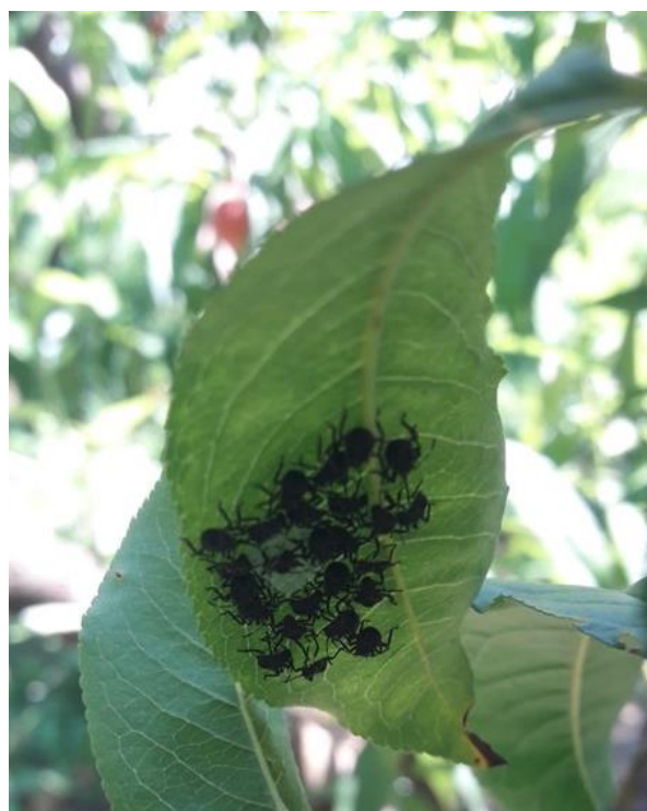
Forme giovanili di H. halys in prossimità di un'ovatura