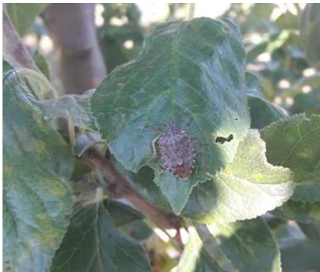
Adulto di H. halys su foglia di susino europeo