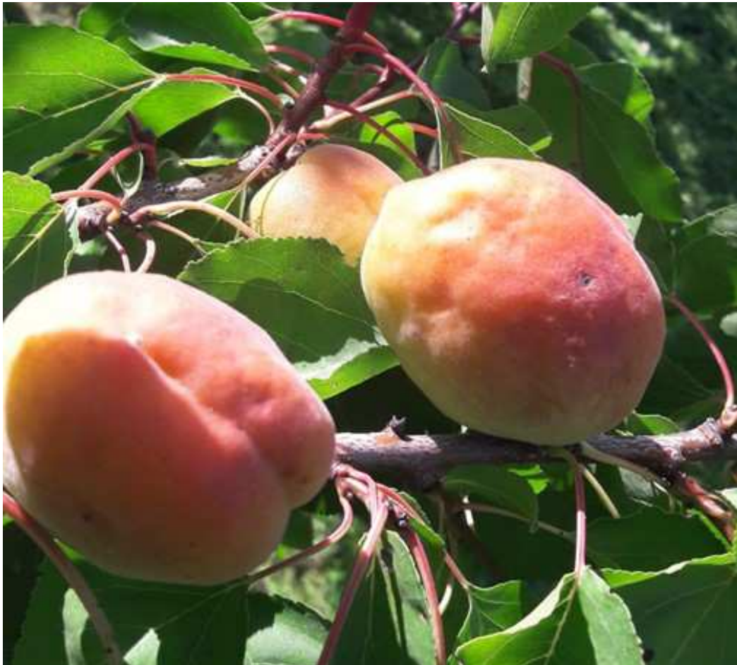
Danni causati da H. halys su frutti di albicocco prossimi alla raccolta