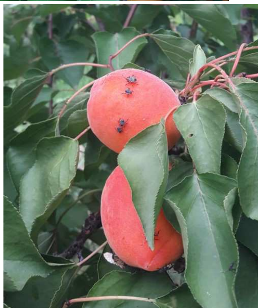
Adulti e forme giovanili di H. halys su frutti di albicocco prossimi alla raccolta