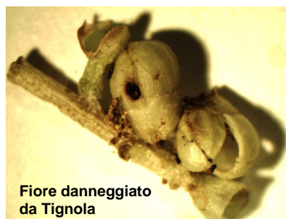
Fiore danneggiato da Tignola

I rilievi settimanali confermano la prevalente riduzione dell'attività di volo della tignola in tutti i comprensori, come evidenziato dalle catture degli adulti di entità bassa e/o trascurabili, che confermano l'esaurimento prossimo della generazione antofaga del fitofago (vedi tabella 1).