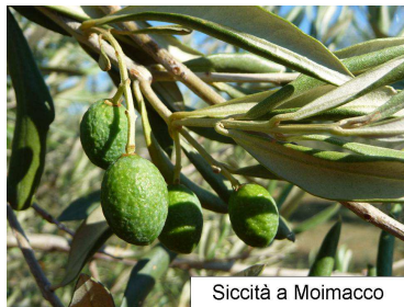
Siccità a Moimacco