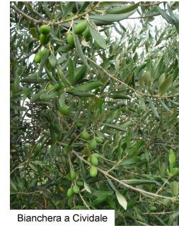
Bianchera a Cividale