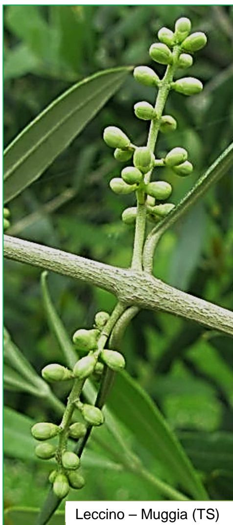
Leccino – Muggia (TS)