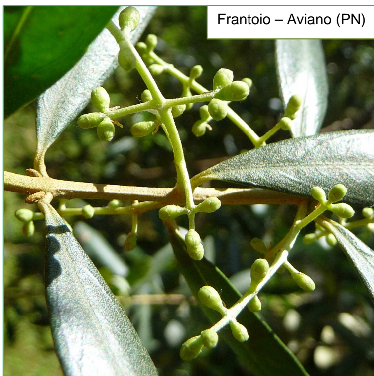
Frantoio – Aviano (PN)