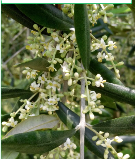
Pendolino - Tricesimo (UD)

Per la prossima settimana si avranno ancora condizioni di cielo sereno o velato con possibili episodi temporaleschi. Le temperature massime permarranno alte, tra i 28 e i 30 °C. Le previsioni meteorologiche regionali dettagliate per i prossimi giorni sono consultabili sul sito http://www.osmer.fvg.it .