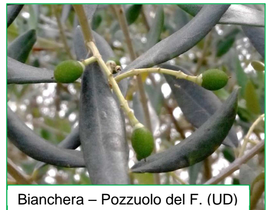
Bianchera – Pozzuolo del F. (UD)

In alcuni oliveti si osserva un incremento della presenza di cocciniglia dell'olivo. Si consiglia di monitorare il proprio oliveto per osservare la presenza di scudetti e di eventuali fumaggini sulle foglie.