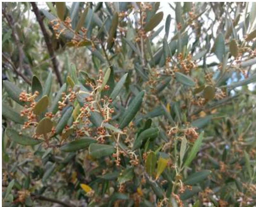
Fiori di leccino bruciati dal caldo zona Medeazza

Si riscontrano nelle zone caratterizzate da una fioritura più tardiva un abbruciatura dei fiori causata da eccessi di calore dovuta alle temperature che nei giorni scorsi hanno superato anche i 30 °C.