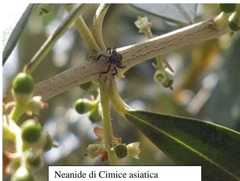
Neanide di Cimice asiatica