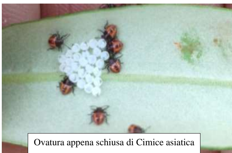
Ovatura appena schiusa di Cimice asiatica

Per informazioni più specifiche sul ciclo biologico consultare il bollettino dedicato alla cimice asiatica.