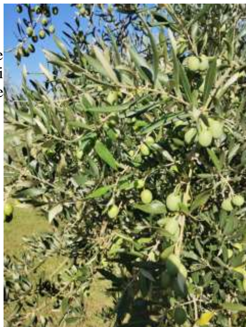
Foto: Bianchera zona Slivia

In tutti gli areali la fenologia per la varietà Bianchera e Leccino è di secondo accrescimento del frutto. Nella zona di Muggia è iniziata la maturazione della varietà Maurino e Leccino.