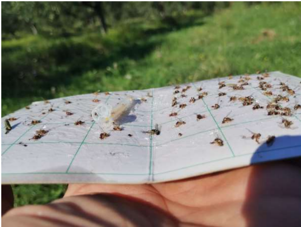
Foto: Catture Bactrocera Oleae zona Montedoro

Agenzia regionale per lo sviluppo rurale