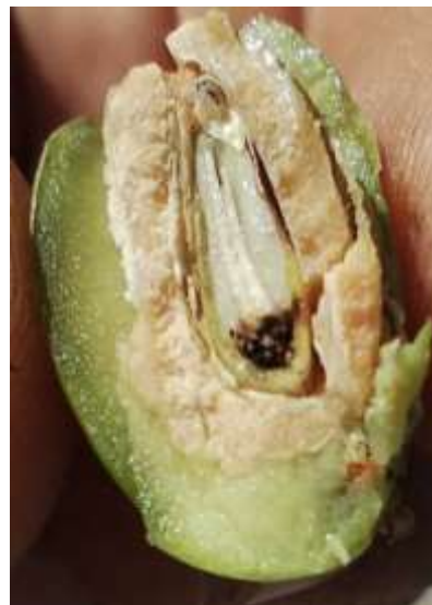
Foto: olive colpite da Batrocera Oleae (danno grave)