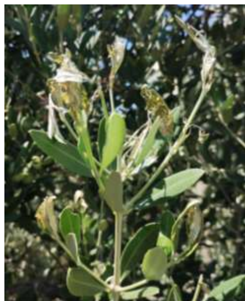
Foto: rami e olive danneggiati da Margaronia

Difesa: Si consiglia in caso di forte infestazione il trattamento con Bacillus Thuringensis , tale intervento si dovrà effettuare verso le ore serali per evitare che il batterio si devitalizzi.