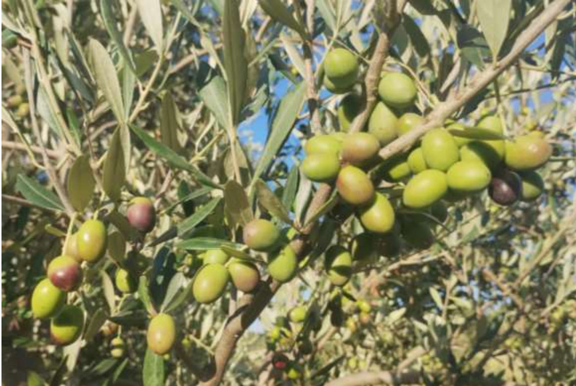
Foto: Leccino zona San Dorligo della Valle

In diversi areali la varietà Bianchera è allo stadio fenologico di secondo accrescimento tranne per le zone di Muggia e di San Dorligo della Valle ove si rileva l' inizio dell' invaiatura. La varietà Leccino continua la maturazione delle drupe in tutti gli areali.