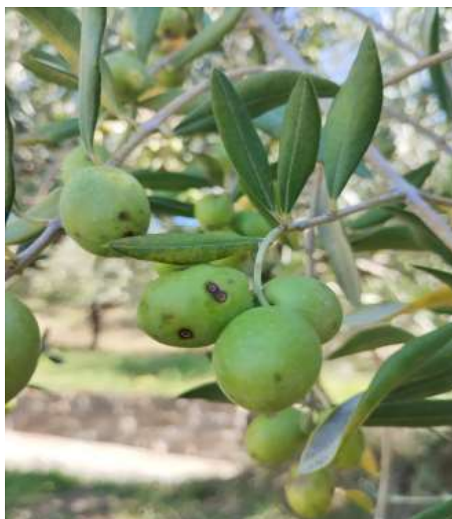
Foto: 3 fori di uscita su oliva causati da mosca olearia

In alcune zone è stato rilevato un lieve incremento delle catture del dittero, dall' analisi delle olive vi è una grossa presenza di pupe vive prossime a dar vita ad un nuovo esemplare adulto, le piogge ed il calo termico hanno rimandato la fuoriuscita della generazione di mosca olearia mentre in altre aree (come si evidenzia dalle catture presenti in tabella), ha sfarfallato la generazione settembrina.