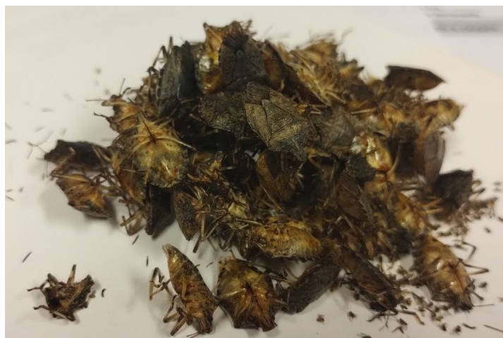
Foto Cimici asiatiche catturate zona San Dorligo della Valle