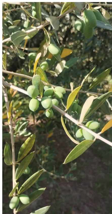
Foto: Leccino zona Selz