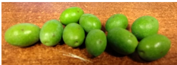
Foto: punture di ovideposizione di mosca su oliva

Le temperature elevate stanno ostacolando l' infestazione e la proliferazione del parassita, in quasi tutte le zone e su varietà a drupa grossa vengono rilevate parecchie punture sterili. Nell' areale di Muggia, S. Dorligo e Trieste dall' analisi al microscopio si rilevano diverse ovature e larve di prima età morte.