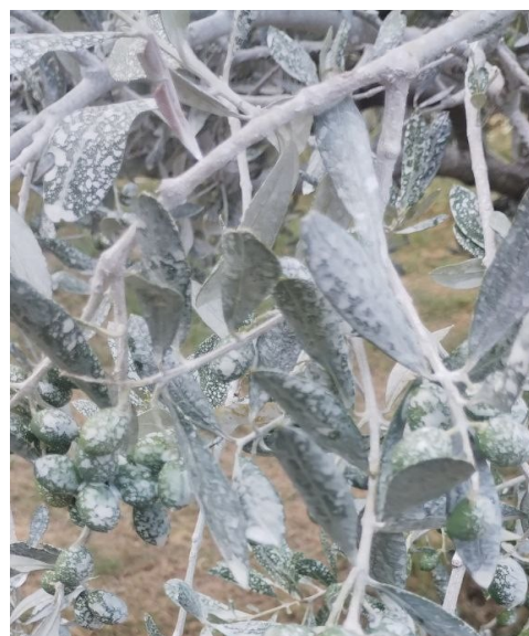
Foto: trattamento con Caolino