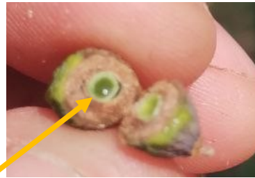
Foto: oliva colpita da cimice

Nel primo caso l'oliva assume una decolorazione tendente al verde chiaro dopodiché tende a staccarsi dal picciolo, al taglio l'interno è vuoto.