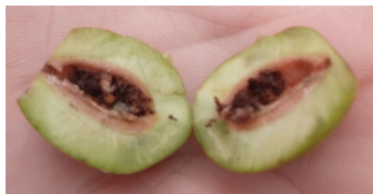
Foto: sezione longitudinale oliva colpita da tignola