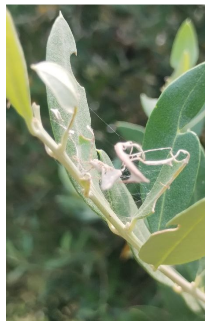
Foto: danno su apici fogliari