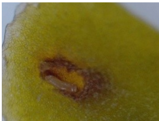
Foto: uovo morto di mosca olearia