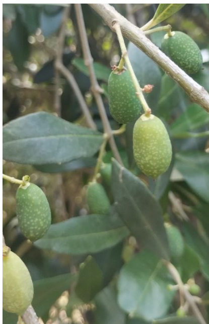
Foto: olive sane più chiare prossime alla cascola

Ricomincia il “fenomeno” della cascola precoce delle olive, dovuta alla mancata o scarsa impollinazione, sezionando l' oliva si nota la mancanza dell' embrione all' interno del seme che non ha richiamato più nutrienti e acqua dalla pianta, a differenza dell' azione trofica della cimice marmorata asiatica che produce cascola ma lascia visivamente intatto l' interno del seme. Entrambe le cascole continuano fino alla fase fenologica dell' indurimento del nocciolo.