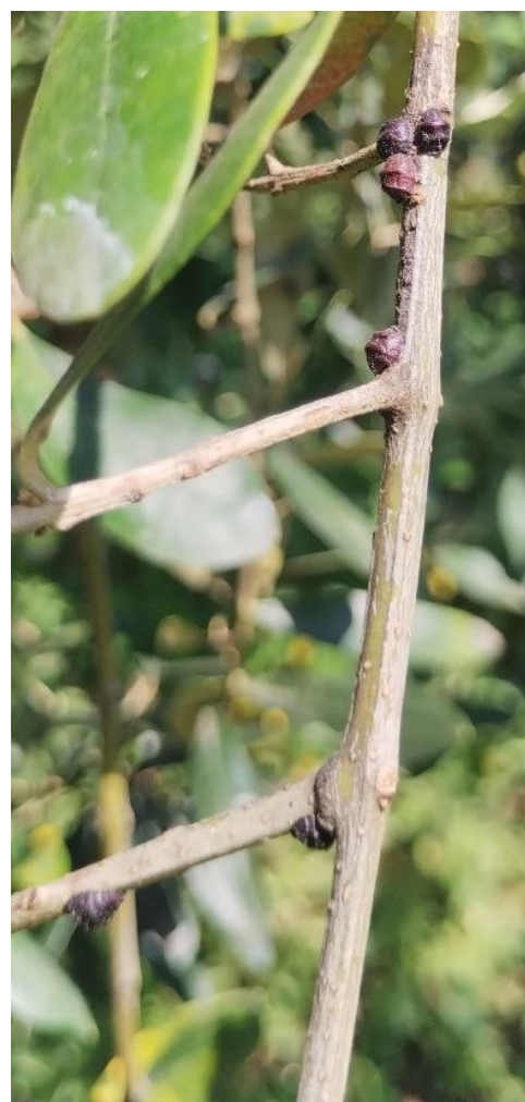
Foto: adulti di cocciniglia mezzo grano pepe

Difesa: Difesa: Si consiglia di intervenire dopo che ha ovideposto (quando sono schiuse il 70/80% delle uova) con olio bianco o con olio minerale ( importante che ci sia una buona umidità relativa perché sia efficace ), con Sali potassici di acidi grassi così da ridurre la presenza dell' insetto, ripetendo il trattamento dopo altri 15 gg. I prodotti vanno dati verso le ore serali per evitare l'effetto "lente" dovuto al sole.