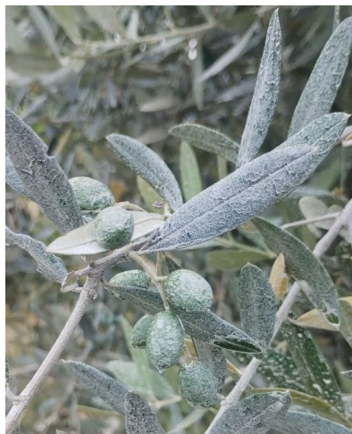
Foto: trattamento con Caolino

Difesa: si consiglia di utilizzare prodotti repellenti quali Caolino o Zeolite per evitare le ovideposizioni, si raccomanda l' utilizzo di un' adesivante per evitare che il prodotto venga dilavato da eventuali precipitazioni e di un bagnante affinché il prodotto venga distribuito omogeneamente sulla drupa.