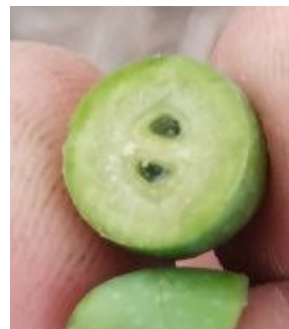
Foto: indurimento nocciolo

Gli olivi presentano la fase fenologica di: