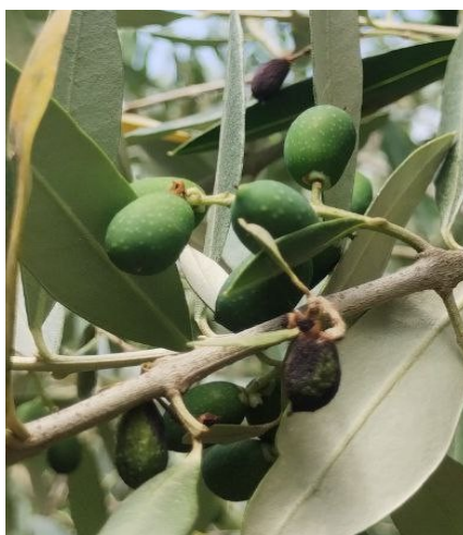
Foto: oliva colpita da cimice