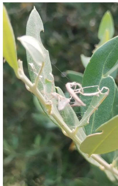
Foto: danno su apici fogliari