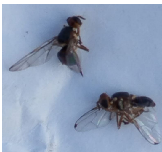
Tabella: catture mosca dell' olivo

Le temperature elevate stanno ostacolando l'infestazione e la proliferazione del parassita, nella zona del muggesano e del triestino vengono rilevate parecchie punture sterili e larve di prima età morte.