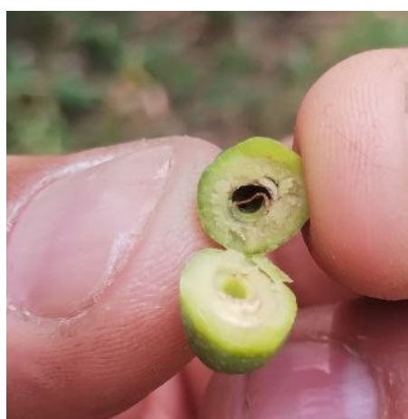
Foto: stessa oliva più chiara sezionata all’ interno senza embrione

Nel primo caso l’ oliva assume una decolorazione tendente al verde chiaro dopodiché tende a staccarsi dal picciolo, al taglio l’ interno è vuoto.