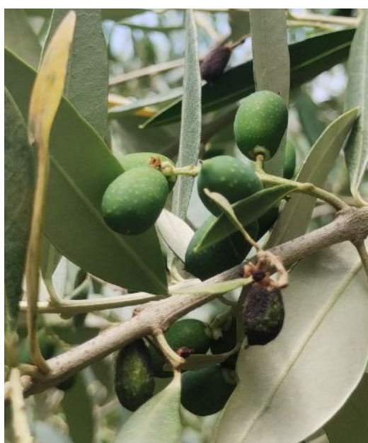
Foto: olive danneggiate da cimice

Viste le temperature elevate l' insetto incomincia ad alimentarsi sempre più spesso per sopravvivere causando forte cascola di olive, in oliveti non trattati siamo al 90% di cascola , essendo la fenologia ancora propizia in quasi tutto il comprensorio regionale, viene consigliato d' intervenire.