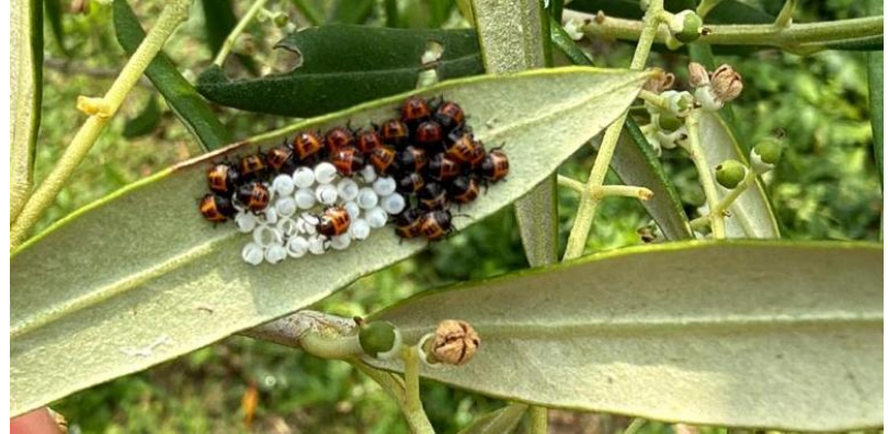
Foto 5 e 6. Ovature di Halyomorpha halys e schiusura delle prime neanidi

In previsione di un periodo di stabilità meteorologica, si raccomandano le seguenti strategie di intervento: