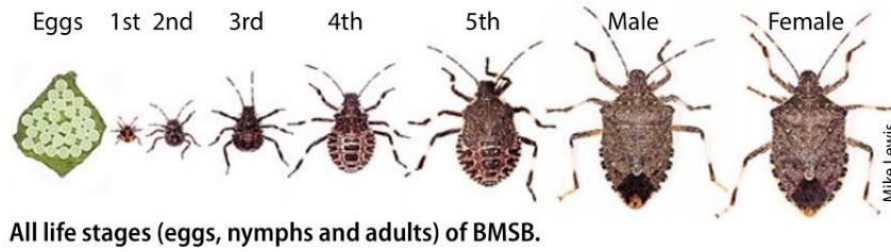
Foto 5. Stadi di sviluppo Halyomorpha halys