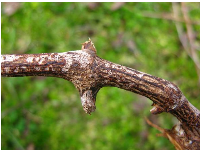
Sintomi di escoriosi alla base del capo a frutto

I sintomi di questa malattia fungina dovuti alle infezioni dello scorso anno si possono osservare nel periodo invernale con la presenza di placche nere, screpolature longitudinali, fessurazioni profonde e suberificazioni a livello corticale, limitate soprattutto agli internodi basali dei capi a frutto. I tralci spesso sono inoltre coperti da una patina grigio biancastra.