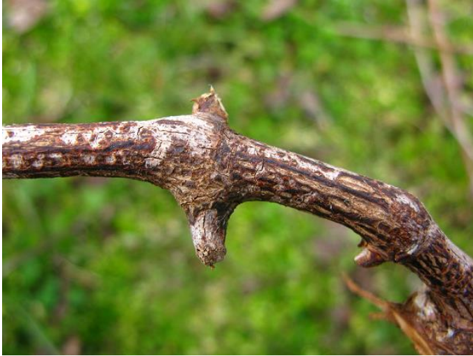
Sintomi di escoriosi alla base del capo a frutto

Dai primi controlli di campo e di laboratorio eseguiti in questi giorni si osserva una presenza di sintomi alla base dei germogli inferiore allo scorso anno (dovuta al mese di maggio 2022 asciutto), si riscontra inoltre una bassa presenza di organi di conservazione del fungo nei vigneti della fascia centro occidentale della Regione, conseguenza dell'autunno 2022 non particolarmente piovoso. Leggermente superiore la presenza di inoculo nella zona orientale dove le piogge autunnali sono state maggiori.