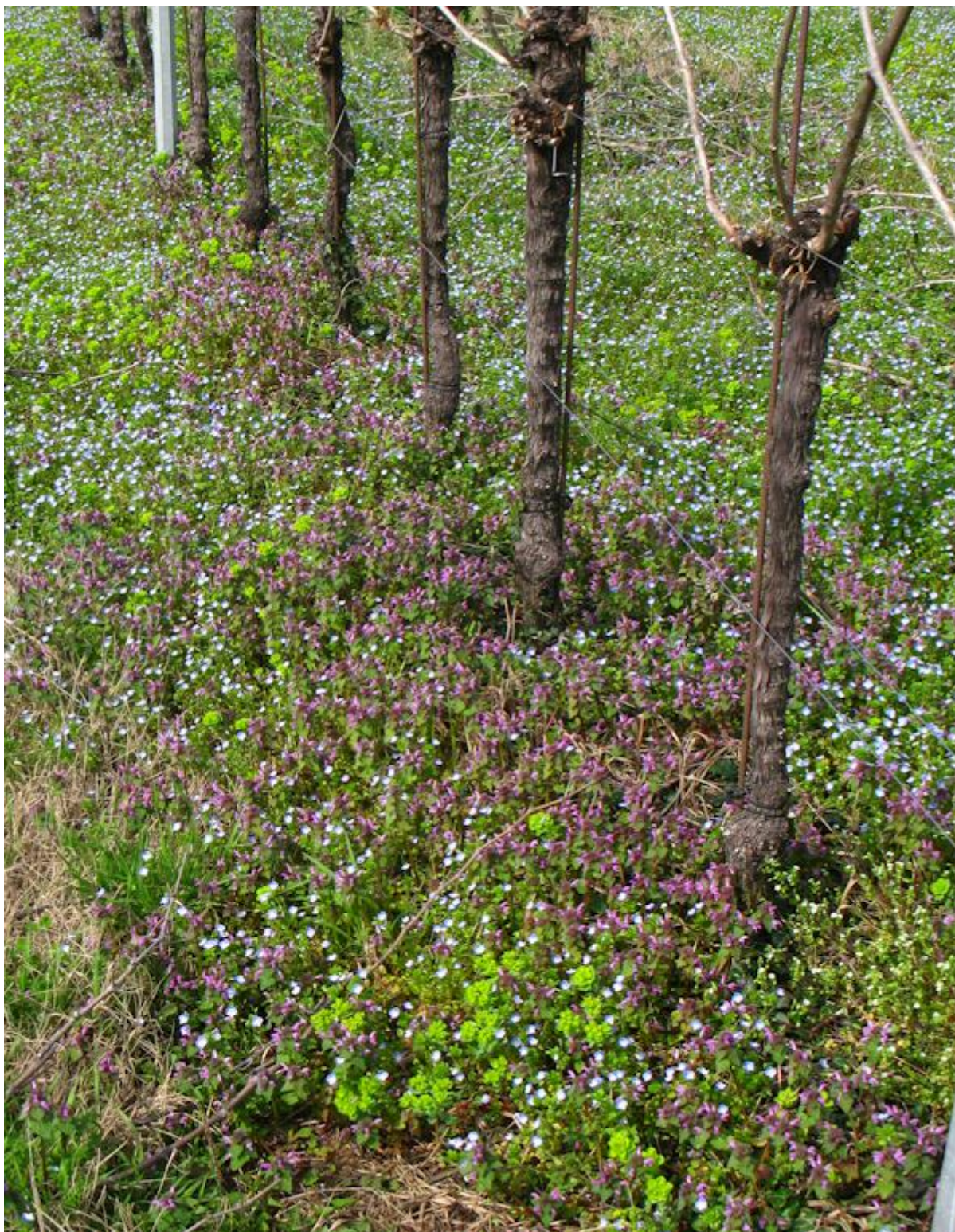
Foto 1. Fioriture di Veronica e Lamio nel sotto fila di un vigneto (12_03_2024)

In questi casi qualora non si possa intervenire con mezzi meccanici o fisici bisognerà rimandare l'intervento chimico dopo la fine della fioritura di queste specie (indicativamente fra circa un mese).