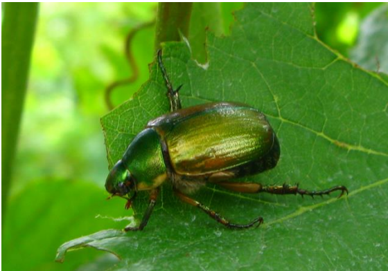
Foto 1 - Adulto di A. vitis su foglia di vite

Anomala vitis (Fabricius, 1775) è un coleottero che si nutre di una grande varietà di alberi, tra cui la vite. Gli adulti di questa specie sono solitamente di una colorazione verde metallico con sfumature che possono andare dal blu al rossastro con ampia variabilità tra i diversi individui (foto: 1 - 2).