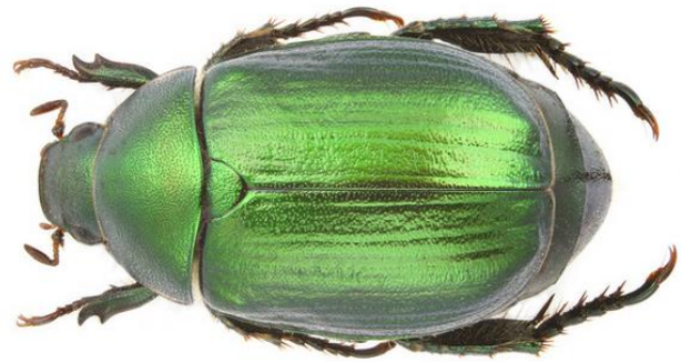
Foto 2 - Adulto di A. vitis

A. vitis , è un coleottero di medie dimensioni (14 - 18 mm di lunghezza) con poche differenze tra i due sessi (limitato dimorfismo sessuale). Compie una generazione all'anno svernando come larva nel terreno.