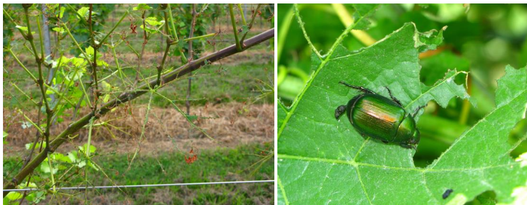
Foto 3 – Danni gravi da A. vitis su vite. Foto 4 – Adulto di A. vitis in alimentazione su foglia di vite.

normalmente si concentrano nei filari esterni spesso in vicinanza di terreni incolti, siepi e boschetti dove l'insetto può svernare indisturbato. La produzione di feromoni di aggregazione fa sì che il numero di esemplari, che attacca singole piante, sia a volte di centinaia di individui.