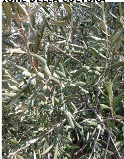
Olive bianchera raggrinzite da siccità prolungata zona Domio