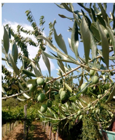
Raggrinzimenti dovuti a siccità in zona Contovello

In alcune zone la scarsa disponibilità idrica ha portato molte piante in sofferenza, soprattutto in presenza di elevate cariche produttive. Si consiglia pertanto di mantenere falciato il manto erboso per ridurre la competizione con le piante erbacee.