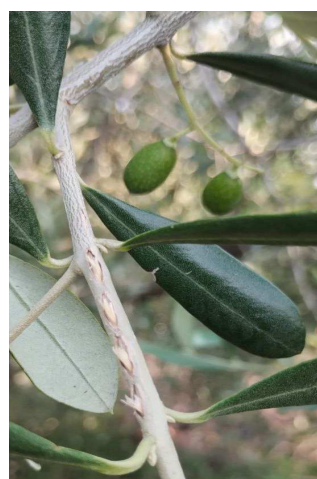
Foto: Fori di entrata per ovideposizione su rametti giovani di cecidomia suggisorza