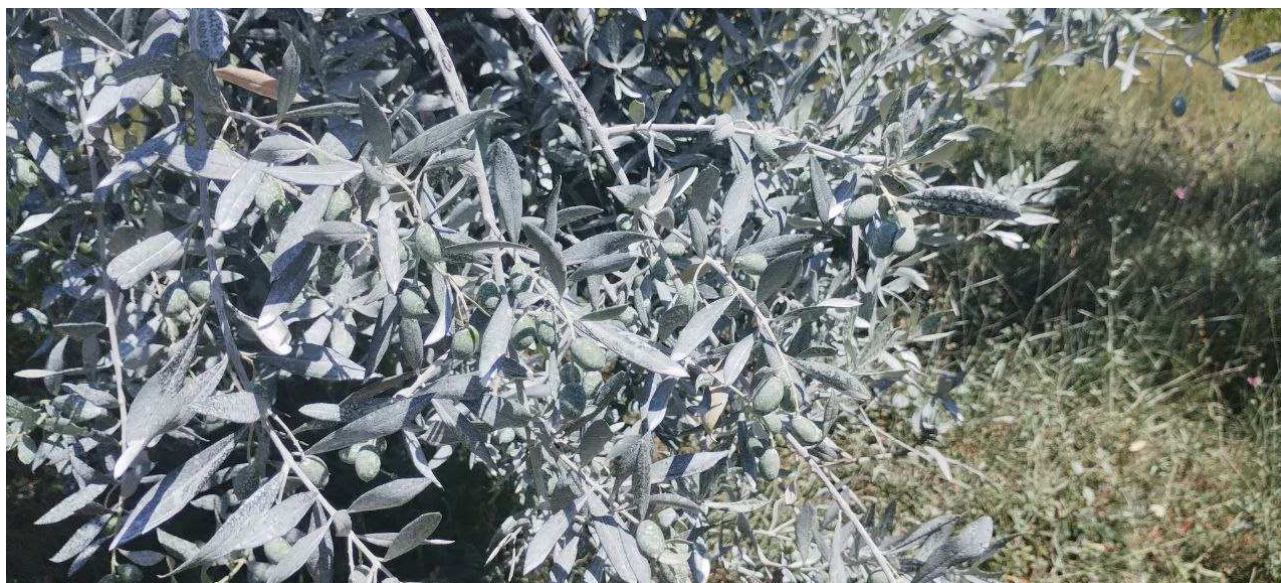
Foto: olivo trattato con caolino

Difesa: si consiglia l' intervento (viste le recenti precipitazioni) con un trattamento con prodotti adulticidi a base Spinosad per ridurre la quantità di adulti e quindi l' infestazione. Qualora non si opti per la lotta adulticida, si raccomanda l' utilizzo del caolino/zeolite come repellente alle ovideposizioni assieme ad un adesivante.