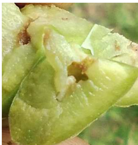
Foto: larva di Bactrocera Oleae di seconda età

Le recenti precipitazioni e l' abbassamento termico ha fatto registrare un aumento delle catture del dittero in molti comuni.