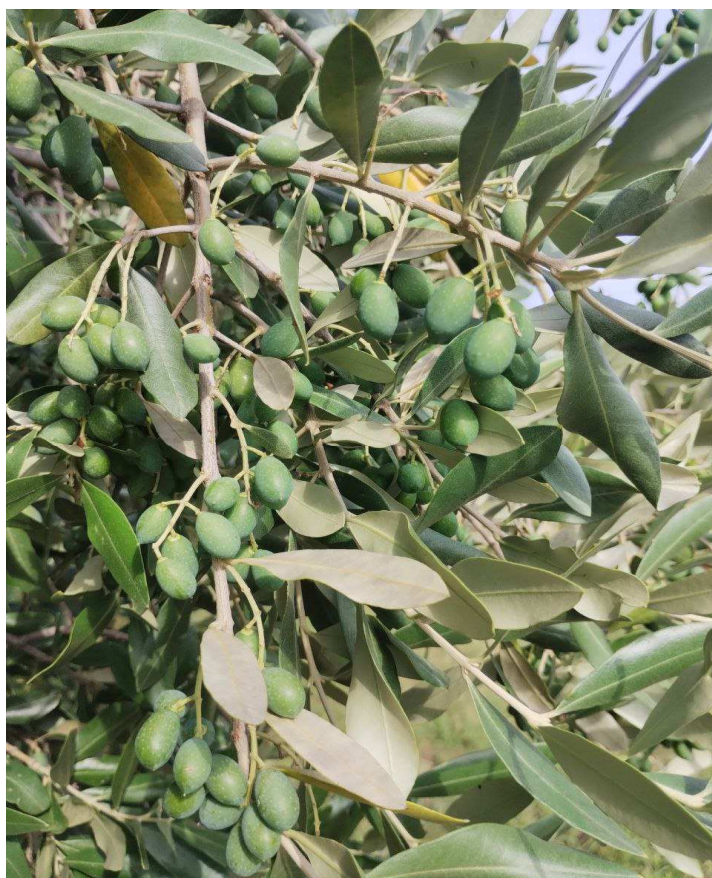
Foto: Leccio del Corno zona Campanelle - Trieste

In quasi tutti gli areali la fenologia per la varietà Bianchera è secondo accrescimento. Il Leccino ha iniziato il pre-indurimento del nocciolo in tutte le zone, negli areali più precoci abbiamo già il secondo accrescimento del frutto.