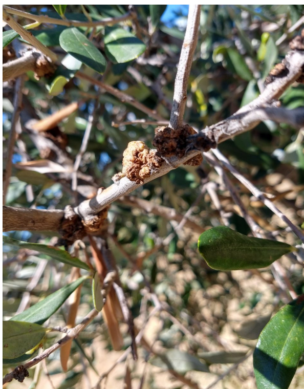
Foto: Rogna dell'olivo

Si raccomanda qualora l'oliveto abbia subito danni da grandine di intervenire con prodotti rameici il prima possibile, per evitare l'insorgere di patologie come la Rogna la quale è un'infezione di origine batterica causata da Pseudomonas sevastano che penetra attraverso le ferite sulla pianta dovute a potatura, grandine, abbacchiatori a rastrello, gelo, danni da vento o danni da animali selvatici e che forma dei tubercoli. Questi cancri sviluppati nel tempo oltre a dar luogo ad altre infezioni indeboliscono molto la pianta fino a far cessare la produzione