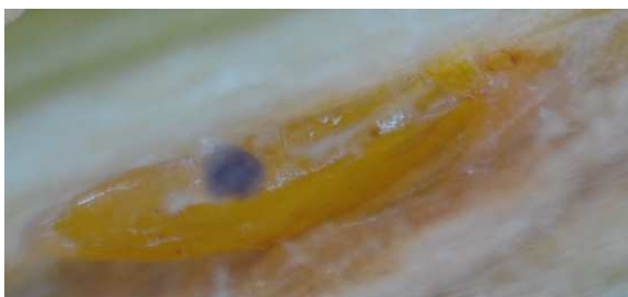
Ovatura di Suggisorza

Questo insetto causa la rottura dei giovani rametti a frutto, il quale ovideponendo sotto la corteccia ne compromette la struttura. In caso Di forte infestazione può compromettere la produzione di olive dell' anno successivo.