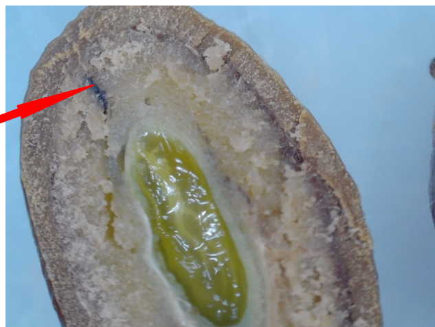
Foto: oliva caduta per puntura cimice asiatica

Continua la cascola precoce delle olive seppur in maniera ridotta, dovuta sia alla mancanza di embrione all'interno del seme che non ha richiamato più nutrienti e acqua dalla pianta sia causata dall' azione trofica della cimice marmorata asiatica perché si sta avvicinando la fase fenologica dell' indurimento del nocciolo. Nel primo caso l' oliva assume una decolorazione tendente al verde chiaro dopodiché tende a staccarsi dal picciolo (non si rilevano punture di cimice), nel secondo caso tende a seccarsi totalmente o parzialmente sulla pianta e a cadere, sezionando l' oliva si rilevano le punture.