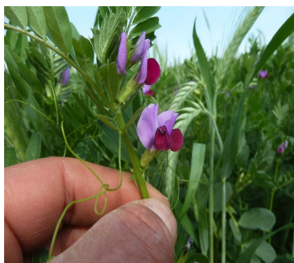
Foto 2. Miscuglio di veccia, favino e triticale, 1-04-2017