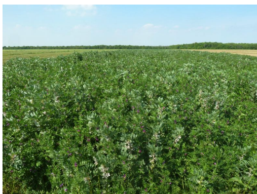
Foto 1. Veccia + favino, 21-04-2016

Con colture da sovescio s'intendono delle colture che non forniscono un raccolto ma che sono destinate ad essere incorporate nel terreno per migliorarne la fertilità (foto 1, 2, 3, 4). Vengono definite anche come fertilizzanti verdi ( green manures ). Con colture di copertura ( cover crops ) si intendono invece delle colture per cui non è prevista una incorporazione nel terreno, ma che dopo la terminazione vengono lasciate in superficie con funzione di pacciamatura. Le definizioni di coltura da sovescio e coltura di copertura vengono comunque spesso usate come sinonimi. Queste colture vengono usualmente seminate tra due colture da reddito ed il loro ciclo colturale (1) può essere più o meno rapido.