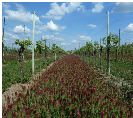
Foto 4. Trifoglio incarnato, 08-05-2012