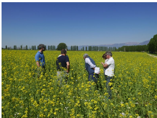
Foto 3. Mix di brassicacee, 19-04-2018