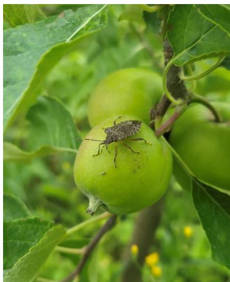
Adulto di cimice asiatica ( Halyomorpha halys ) su frutticino di melo var. Crimson Crisp

Le istruzioni per l'iscrizione al servizio sono disponibili sulla home page del sito ERSA www.ersa.fvg.it