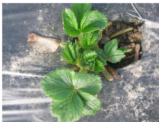
Fragola: a sinistra pulizia non corretta delle foglie a fine inverno, a destra ben eseguita.

Questi funghi possono svernare nei tessuti delle foglie vecchie, sotto forma di micelio o corpi riproduttivi del fungo stesso; l'accurata pulizia ha perciò lo scopo di allontanare la maggior quantità possibile di materiale infetto, causa principale dell'inoculo della malattia. La massa asportata deve essere allontanata dai fragoletti, meglio se bruciata, in modo da distruggere completamente i patogeni. Tali operazioni sono valide anche per eliminare una parte delle femmine svernanti e feconde di ragnetto rosso, annidate nel centro della pianta o sotto le pacciamature.