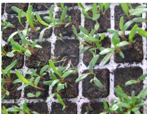
Bietola da taglio: moria delle piantine da Pythium sp. per troppa umidità e scarso arieggiamento.

Un decorso stagionale che presenti il ripetersi di giornate di cielo coperto, piogge e temperature superiori alla norma del periodo, può favorire il manifestarsi di diverse patologie fungine quali muffa grigia delle lattughe, sclerotinia e peronospora che attaccano facilmente colletto e foglie delle piante; invece Pythium sp. , Rizoctonia solani e Fusarium sp. , (anche presenti contemporaneamente) possono provocare, nel caso di semine dirette, delle morie nelle plantule appena emerse che avvizziscono a livello del colletto e presentano diffusi marciumi radicali.