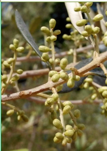
Bianchera – Cividale (UD)

Lo sviluppo fenologico prevalente in tutti i comprensori olivicoli è la fase della mignolatura piena, con boccioli fiorali rigonfi. Negli areali più interni la corolla è ancora di colore verde, mentre negli areali termicamente più favoriti, soprattutto quelli costieri, troviamo singole piante con i primi fiori aperti.