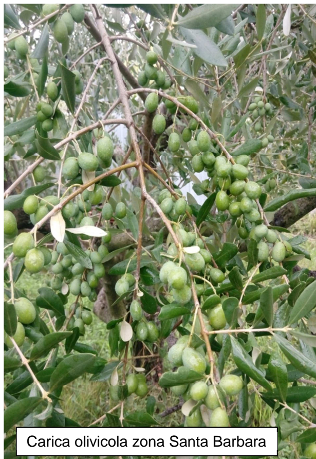
Carica olivicola zona Santa Barbara