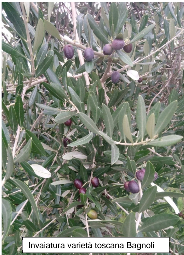
Invaia varietà toscana Bagnoli

Per le varietà toscane siamo all' invaiatura.