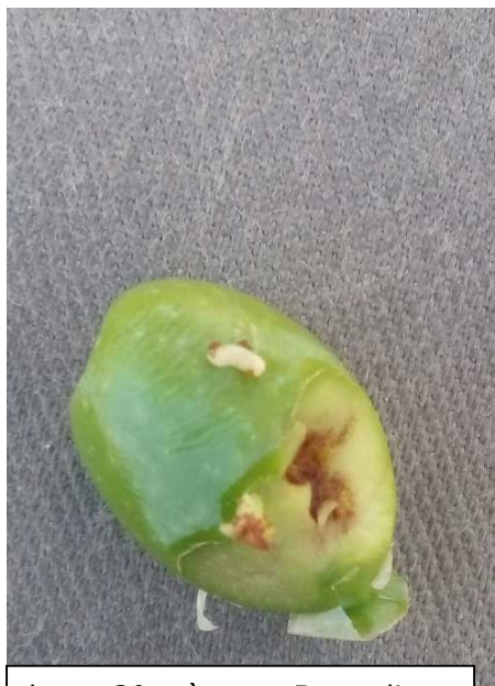
larva 2° età zona Bagnoli