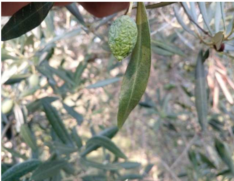
Raggrinzimento oliva causa Fleotribo zona Pisciolon