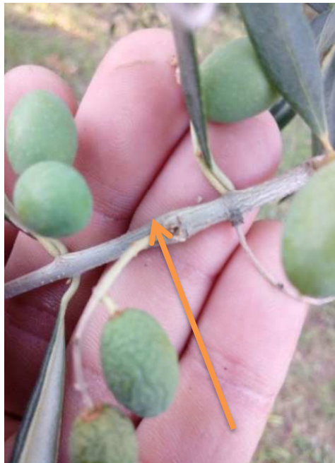
Foro d'entrata del Fleotribo

In diverse zone è stato osservato il disseccamento dei rami e dei frutticini causati dal fleotribo; osservando attentamente si possono riconoscere i fori d'entrata e le gallerie.