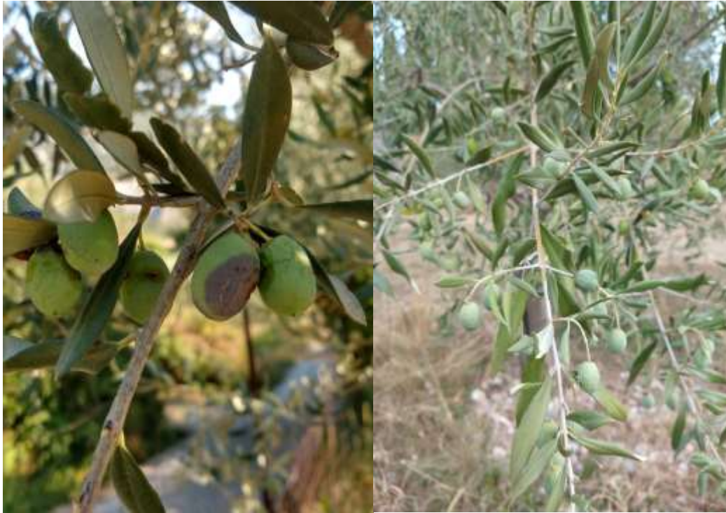
Danni da mosca zona Darsella