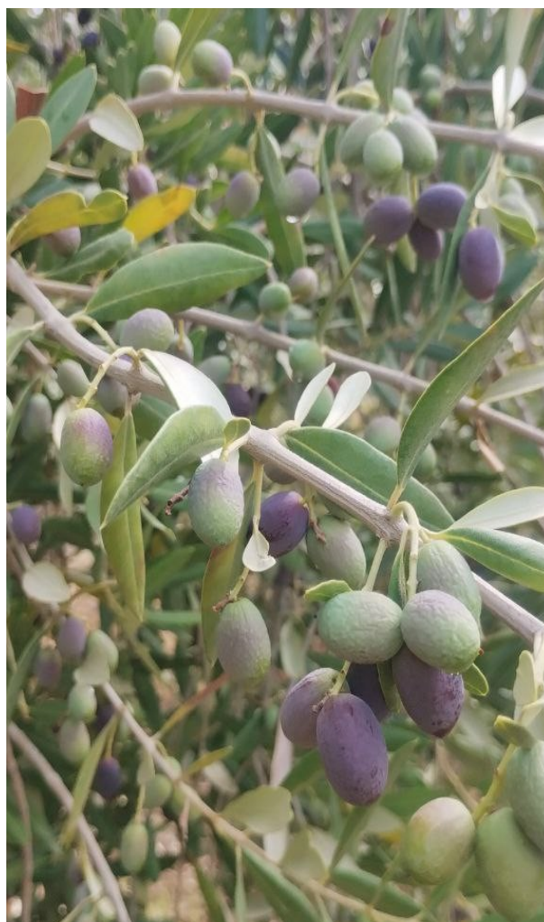
Foto: Leccino zona Trieste