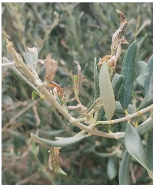
Foto: danni da Margaronia zona Gorizia

Difesa: qualora si incomincino ad intravedere le prime rosure sulle olive utilizzare il Bacillus thuringensis var Kurstaki in prevenzione per abbassare la presenza dell' insetto, il trattamento va dato verso sera, sia per massimizzare l' efficacia del prodotto che per colpire più popolazione dannosa possibile.