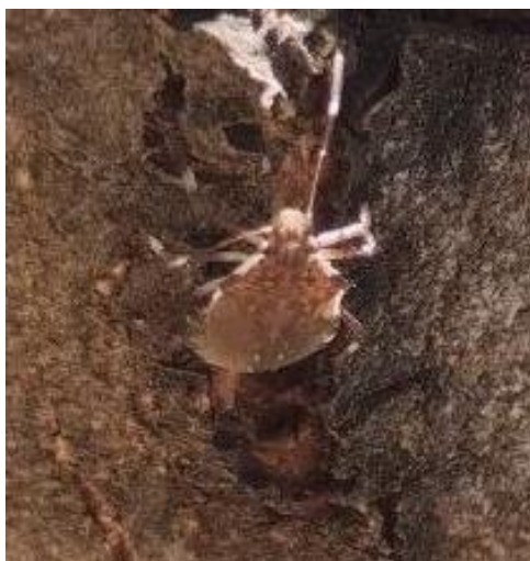
Foto: ninfa di terzo stadio di cimice marmorata asiatica

In questa fase l' insetto tende a forare le olivine per nutrirsi, l' oliva appena punta inizia il processo di deperimento causando cascola, solitamente l' attacco del fitofago avviene vicino a luoghi ove ha svernato quali case o ripari, per poi proseguire l' attività sulle piante limitrofe.