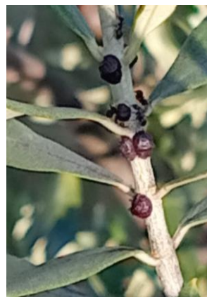
Foto: adulti di cocciniglia mezzo grano pepe

In diversi comprensori monitorati è stata rilevata la presenza della forma adulta della cocciniglia mezzo grano pepe.