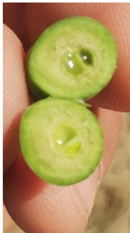
Foto: pre-indurimento del nocciolo Bianchera zona Muggia