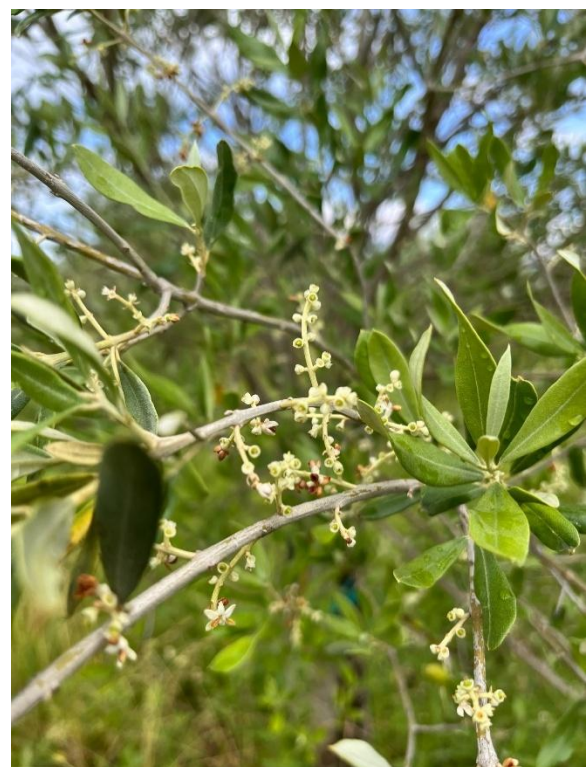
Foto 1 e 2. Varietà Bianchera a Lestizza e Majano