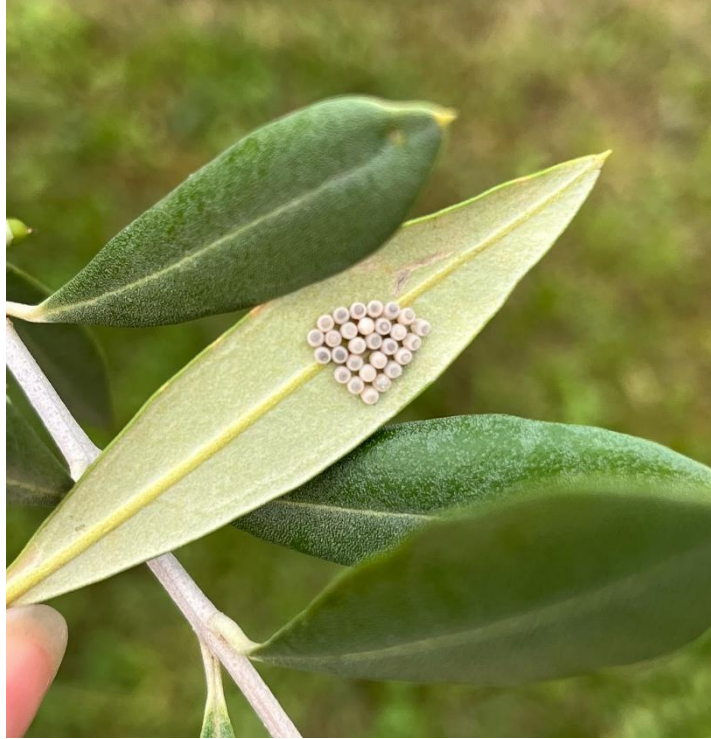
Foto 5. Nella foto ovatura di Halyomorpha halys non schiusa: hanno una forma tipica e un numero di uova di circa 28 ciascuna.

In previsione di un periodo di stabilità meteorologica, si raccomandano le seguenti strategie di intervento: