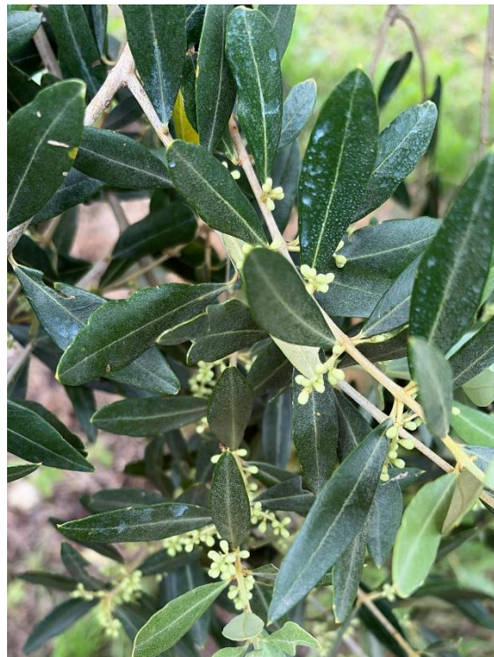
Foto 3 e 4. Varietà Leccino a Gemona e Montereale Valcellina