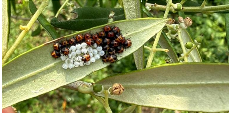
Foto 5 e 6. Ovature di Halyomorpha halys e schiusura delle prime neanidi

In previsione di un periodo di stabilità meteorologica, si raccomandano le seguenti strategie di intervento: