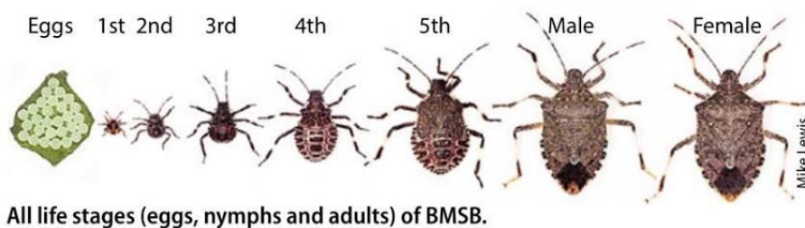
Foto 5. Stadi di sviluppo Halyomorpha halys

Si raccomanda lo sfalcio dell'erba prima del trattamento per preservare i pronubi