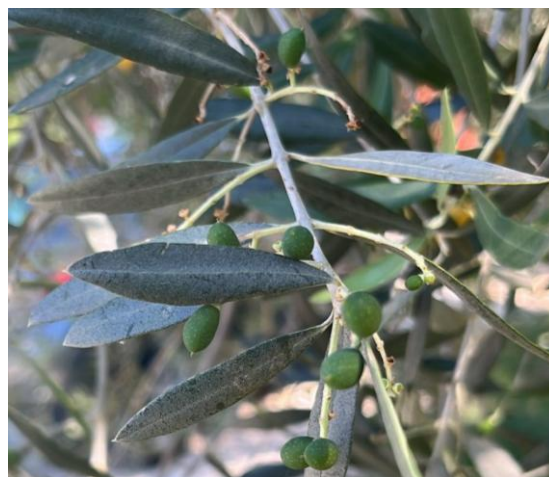
Foto 3 e 4. Varietà Leccino a Montereale Valcellina (PN) e a Cividale (UD)