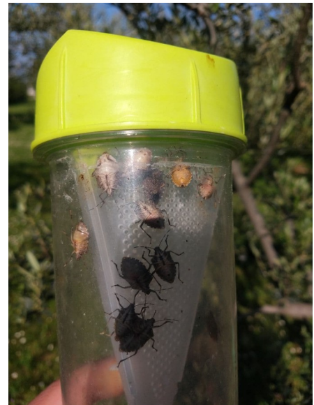
Foto: Cimice marmorata asiatica

dell' olivo e fino all' indurimento del nocciolo.