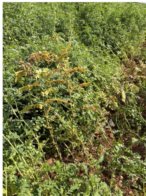
Foto 3 e 4: Cece in fase di formazione dei baccelli e pianta colpita da malattia fungina dell'apparato radicale (probabile Fusarium ) Premariacco 15/06/2026