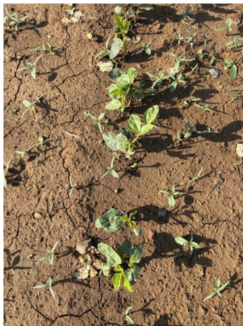
Foto 5 e 6: Fagiolo dolico ( Vigna unguiculata ) seminato il 25 maggio e osservato il 17 giugno (Zugliano), la coltura ha subito un lieve danno da grandine e di lì a pochi giorni verrà sarchiata.