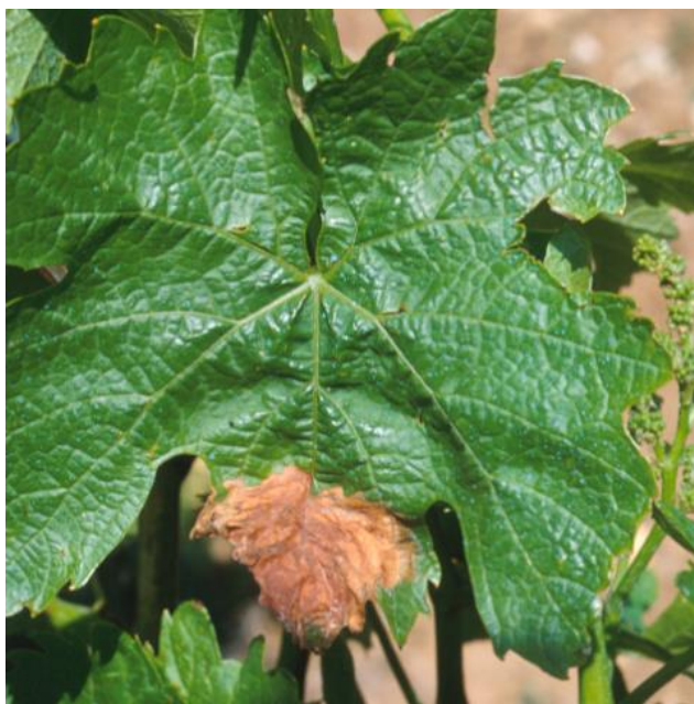
Botrite su foglia