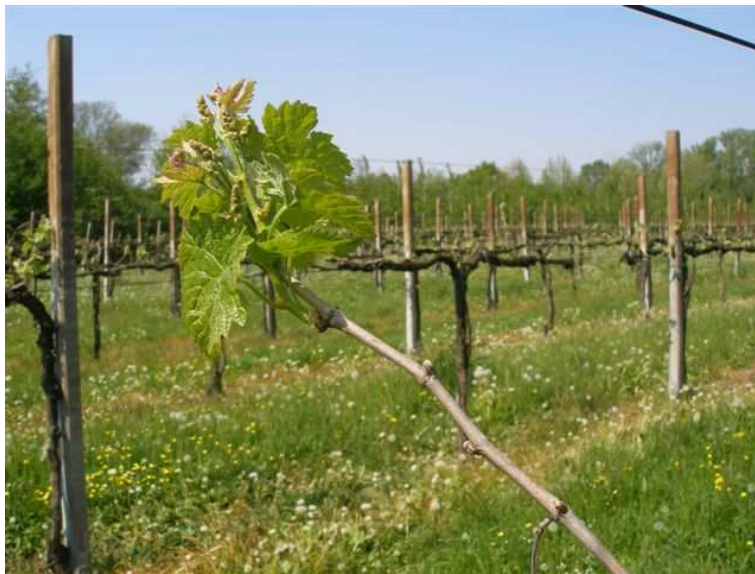
Foto 1: apice di Merlot con grappolo visibile e restanti gemme ferme.

L'abbassamento termico registrato in quest'ultima settimana, in concomitanza con la quasi totale assenza di piogge che sta caratterizzando il mese di aprile, ha favorito sia un leggero rallentamento dello sviluppo vegetativo, - permane comunque un discreto anticipo fenologico rispetto al 2010 -, sia una certa disomogeneità del germogliamento, dovuta peraltro anche alle caratteristiche varietali (vedi foto 1).